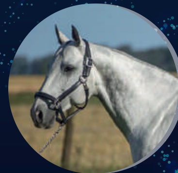
CAPATAZ SPORTIVO X CAPA