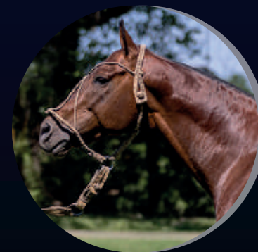
CARAQUEÑO LUHUK X CARACAS