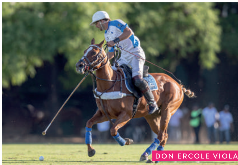
DON ERCOLE VIOLA