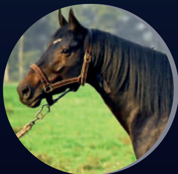
MACHITOS LIDER SPORTIVO X LAMBADA