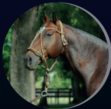
MACHITOS VITICO SPORTIVO X M. VIPARITA