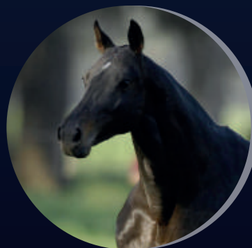
OPEN SAFIN SPORTIVO X RUSITA