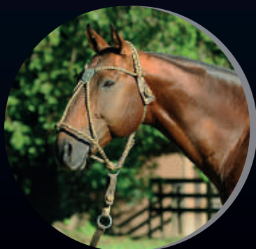
OPEN MILITO OPTIMUM X ELLERSTINA MILI