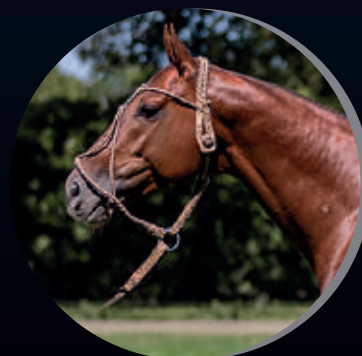
ALBERTA SUPERNOVA OPEN EL PADRINO X CANDELA