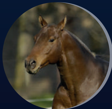
OPEN HAVANETTE OPEN ESPACIAL X HABANA